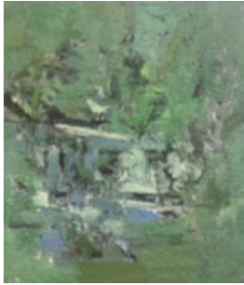
한성우 무제 2020 Oil on canvas 53 × 45.5 cm