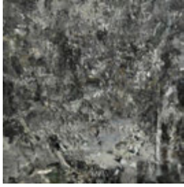
한성우 무제 2017 Oil on canvas 70 × 70 cm