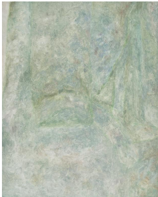
4. 한성우, Untitled, oil on canvas, 27.3 x 22cm, 2022