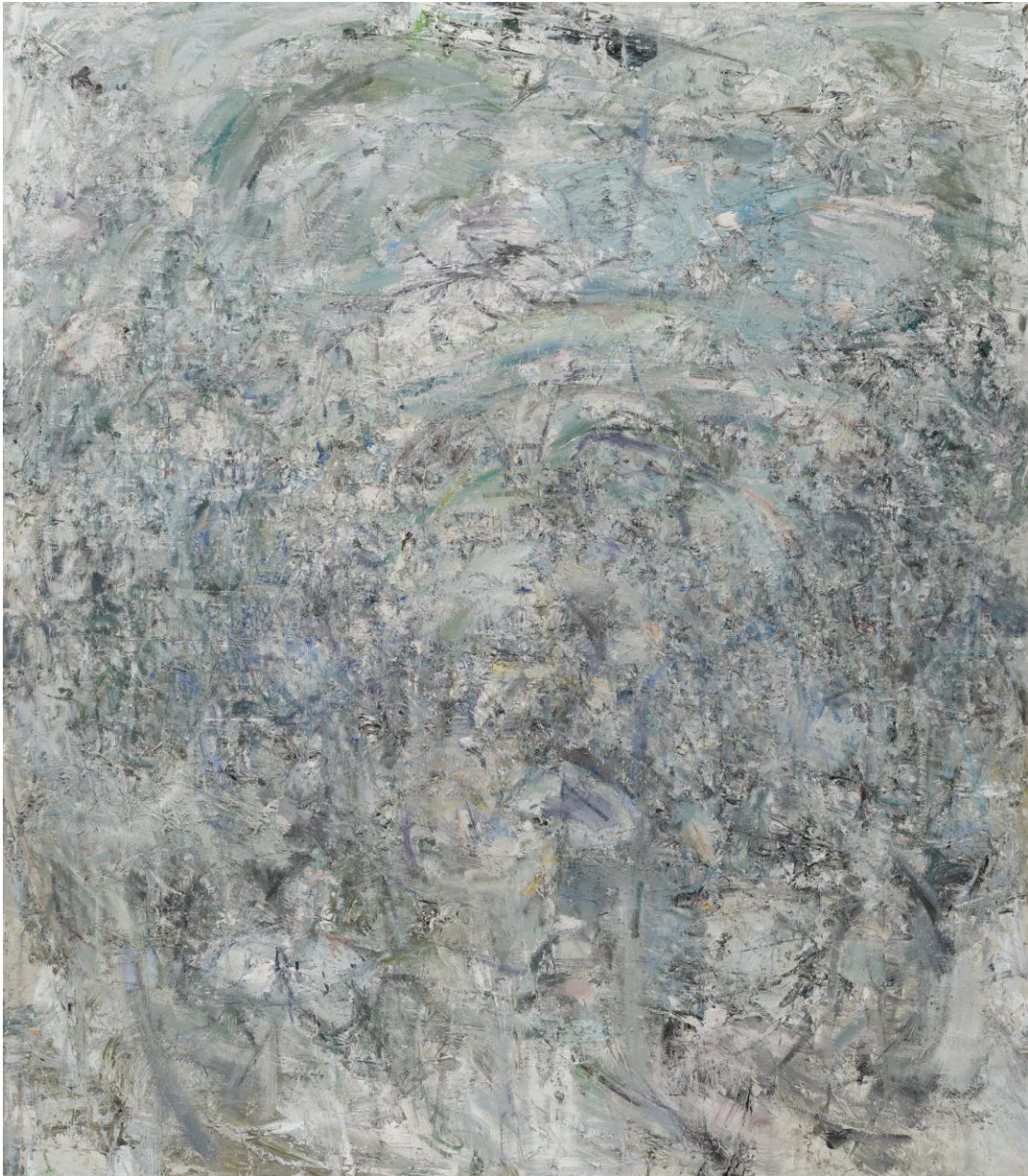
1. 한성우, Untitled(fw.no.33), oil on canvas, 230 x 200cm, 2022