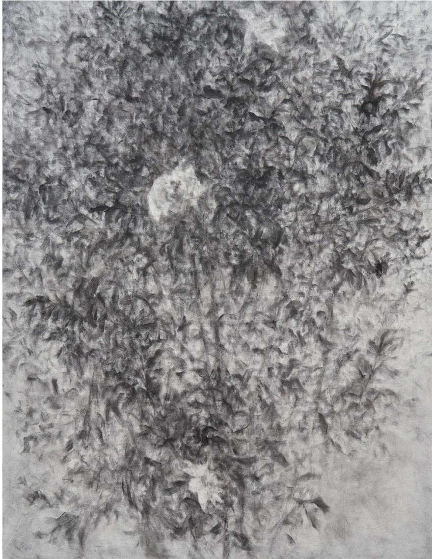
2. 한성우, 석류나무, charcoal on canvas, 145.5 x 112.1cm, 2022