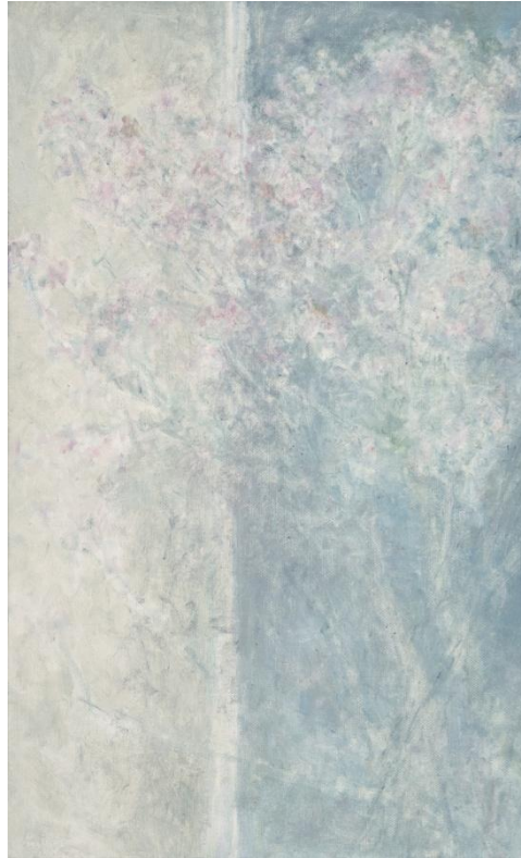
3. 한성우, Untitled, oil on canvas, 45.5 x 27.3cm, 2022